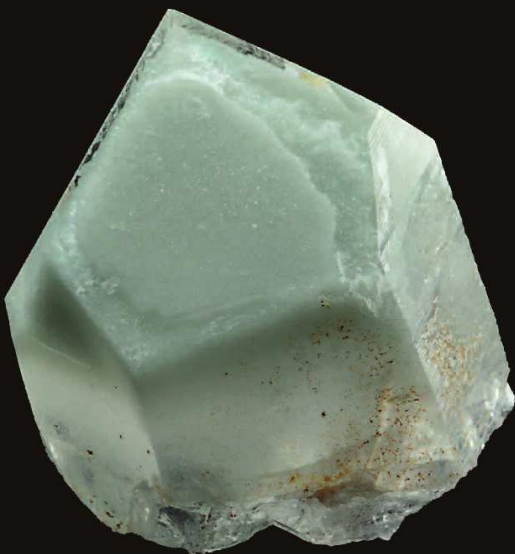
Cristallo di quarzo con fantasma di illite Dosso dei Cristalli Valmalenco