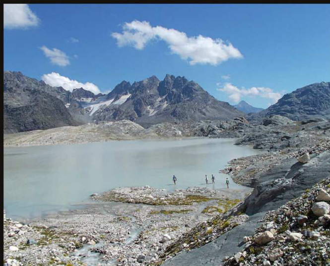
Veduta dall'alta val di Scerscen Escursione in elicottero 2015