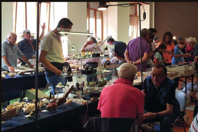
Particolare del Salone dello scorso anno

“I minerali della Valmalenco, tra classici e novità”