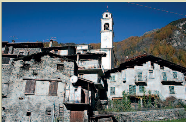
Veduta di Lanzada