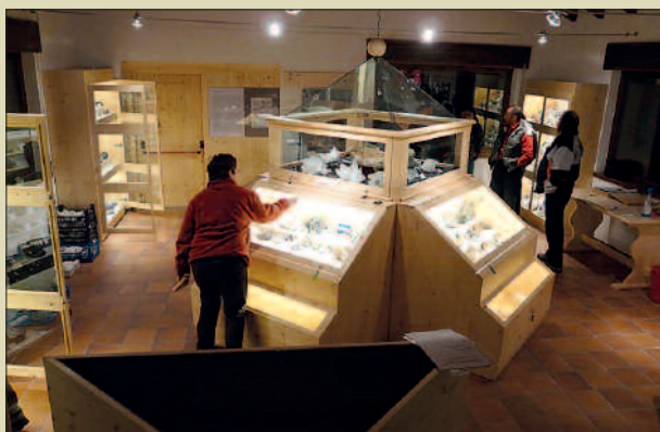
Museo dei minerali della Valmalenco