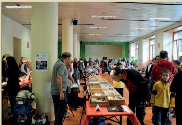
Salone della Mostra Scambio dello scorso anno

Nel corso delle due giornate è possibile visitare il Museo Mineralogico della Valmalenco e il Museo Minerario della "Bagnada"